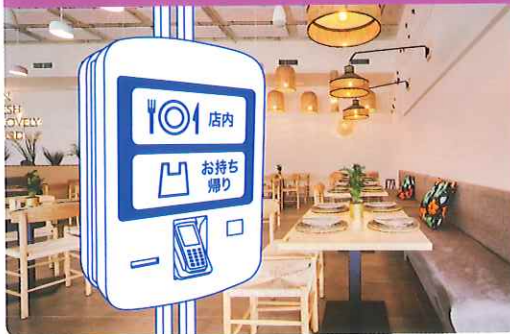
例えば、飲食サービス業 × 券売機