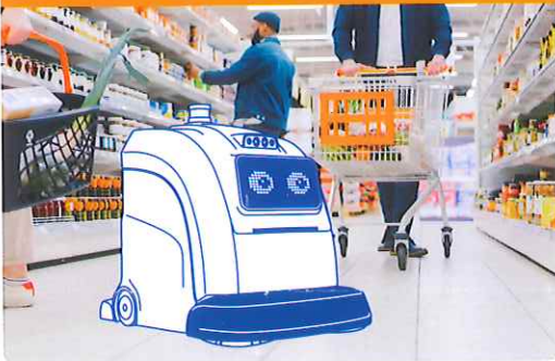
例えば、小売業 × 清掃ロボット